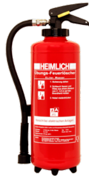
HEIMLICH® Ü 6-2