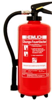
HEIMLICH® Ü 9-2