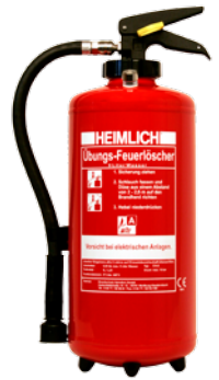
HEIMLICH® Ü 9 M-2