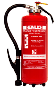
HEIMLICH® Ü 6 S-2